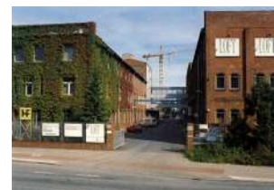
Ehemalige Margarinefabrik an der Stresemannstraße 375

3“-Liste) herausnimmt. Damit würde der Weg frei werden über Verhandlungen zum Erwerb der Anlage durch die Nutzer. Eine erste Vollversammlung hat bereits stattgefunden. Die beiden Kammern stehen auch dahinter.