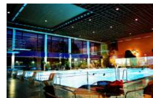
Bäderland-Bad Budapester Straße: Wird es geschlossen nach der Eröffnung des Neubaus an der Holstenstraße?

auf, dass ein Bürgerentscheid übergangen wurde? Braucht Altona wirklich ein „Mercado 3“? Auf dem Gelände des Bismarckbades sollen weitere Einzelhandelsflächen entstehen. Für die Große Bergstraße wird das ein weiterer Sargnagel!