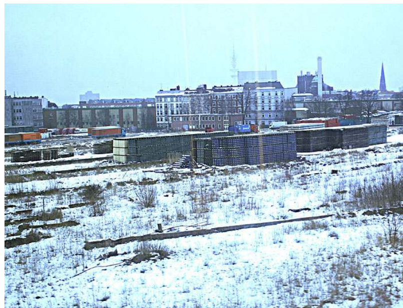
Das weitgehend brach liegende frühere Bahn-Gelände an der Harckortstraße wurde von der Holsten AG erworben und ist entwidmet.

Politik und Verwaltung im Altonaer Rathaus hoffen jetzt darauf, dass Holsten nach der Umstrukturierung die Betriebserweiterung wie geplant auf dem ehemaligen Bahngelände realisiert.